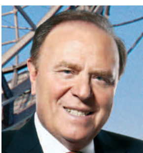
Ennio Doris, Presidente di Banca Mediolanum.

Dice Ennio Doris, fondatore e Presidente di Banca Mediolanum: "25 anni fa ho pensato a una banca costruita intorno alle persone. Banca Mediolanum è nata così: e ora ha oltre un milione di clienti. E il Family Banker™, il professionista di nuova generazione che porta la banca direttamente a casa dei suoi clienti, è stato la chiave di volta di questo successo. Perché, certo, la tecnologia è importante: e infatti con i nostri canali Internet, telefono e tv le